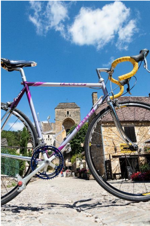
Les gagnants :